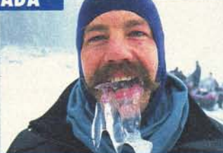
Eiszeit: Der Kufenritt durch Ontarios Winter-Märchenlandschaft macht Spaß und ist gar nicht schwer