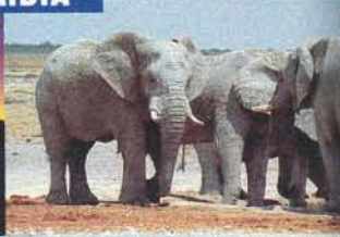
Kolossal: großartiges Naturschauspiel mit manchmal ganz schön dicken Akteuren, nur die Schilder scheinen vertraut

Hinterm Horizont geht's noch weiter: ob Namibia, Chile, Kanada, Australien oder sonstwo